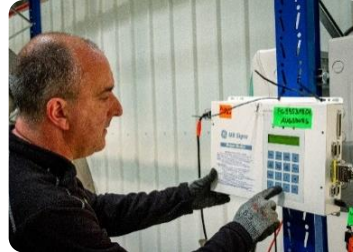
Magnetparameter und Heliumpegel werden täglich überwacht und geprüft