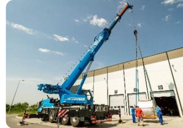
Installation und Einbau neuer OEM-Teile