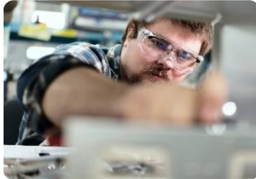
Dekontamination, Inspektion und Tiefenreinigung